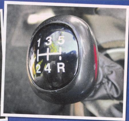
Opotřebované se také hlavice řadič páky. Samozřejmě záleží na materiálu, ze kterého je vyrobena.