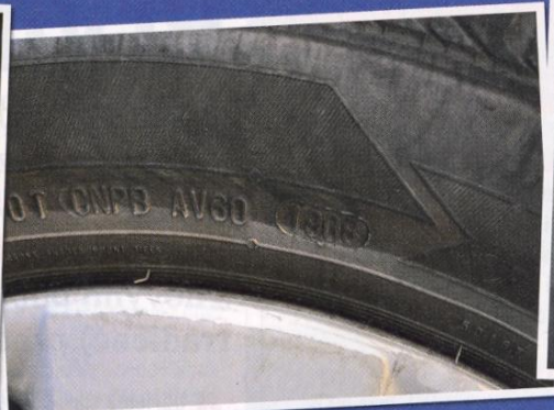
Každá pneu má vyražena čísla s datem výroby (v tomto případě 1908 znamená 19. týden roku 2008). Použití starších pneu, než je auto, je podezřelé.