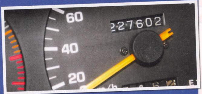
Při koupi ojetin se v podstatě údaje na tachometru nedá věřit, mnohem důležitější je celkový stav auta. I přes to drtivá většina lidí vybírá auto podle najetých kilometrů – to jsou reálné zkušenosti z bazarového trhu.