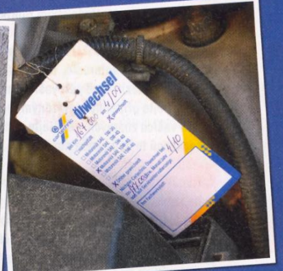
Na štítky o datech výměn oleje nebo rozvodového řemene může stáčírna zapomenout – mohly by prozradit pravdu.

další. Stojí to sice 500 korun, ale pokud kupujete auto za 200 000 Kč nebo tak, určitě se to vyplatí.