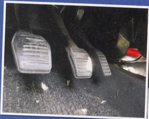
Ošoupané gumy pedálů ledacos prozradí. Auto, které má více než 100 000 km, mívá ošoupanou zejména pravou stranu brzd.