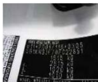
typový štítek - detail